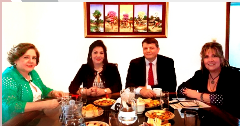
Viceministro de Comercio Dr. Oscar Stark y Directoras CONVUE

El objetivo manifiesto del Consorcio Ventanilla Única de Exportación (CONVUE) es sostener, mantener y evolucionar en los servicios otorgados por la Ventanilla Única del Exportador (VUE) a partir de los aportes que los usuarios del sistema realizan como un reconocimiento al mejoramiento que ha experimentado el proceso de tramitación de las exportaciones con la implementación del sistema VUE y con el propósito de que las prestaciones sean sustentables en el tiempo.