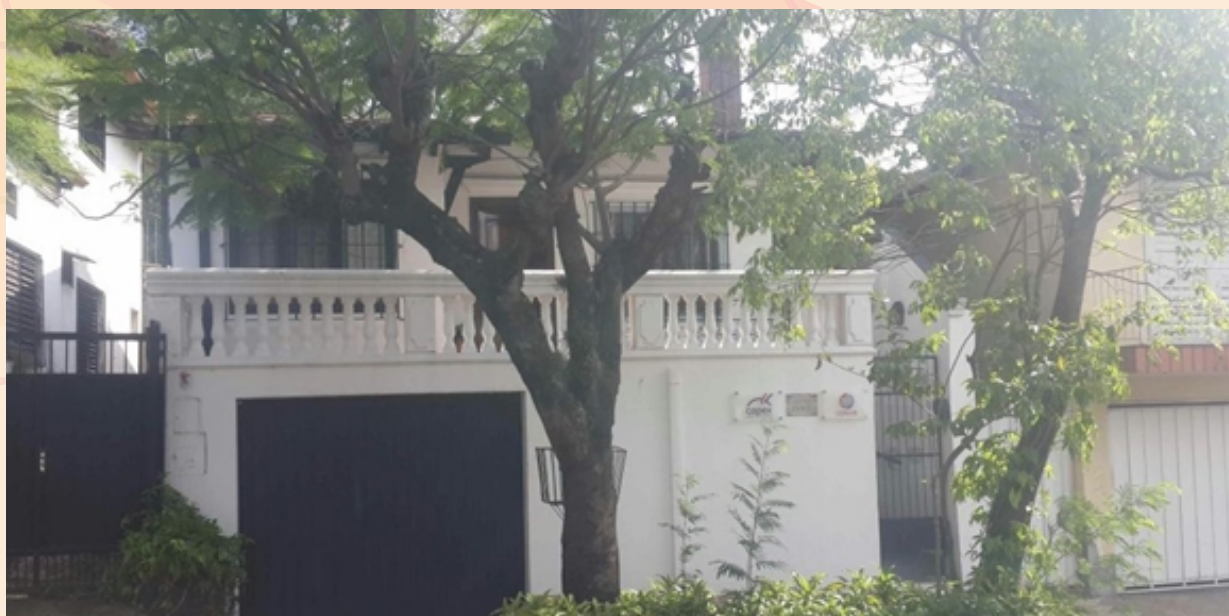
Fachada Principal oficinas CONVUE

La contabilidad del Consorcio está cargo de la firma NCG Consultores.